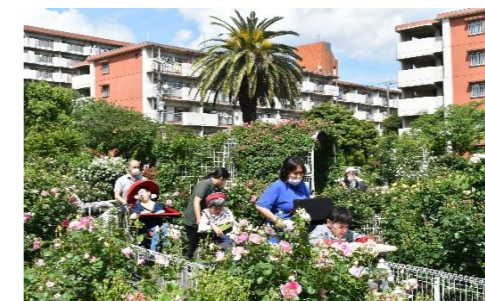
バラに囲まれ優雅なひと時を。