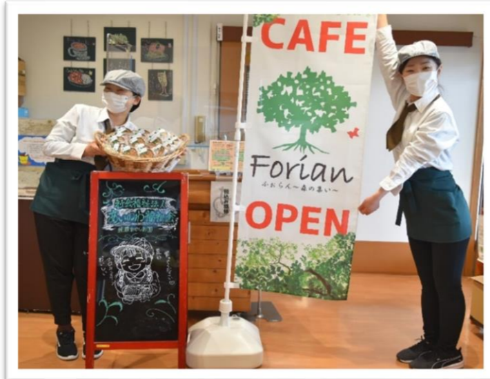
皆様のご来店、お待ちしております！！

ふわふわのパンケーキは、ご利用者の方からも「美味しい！」と大好評の人気メニューです。焼き菓子（フロランタン、ガレット、マドレーヌ）やドリップコーヒーの販売もしています！