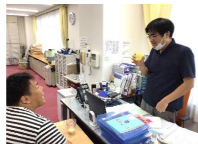
施設長にもおすそわけしました。