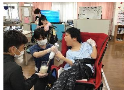
上下して上手く混ぜ合わせます。