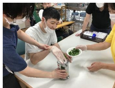
ほうれん草をミキサーに！

3年ぶりに調理活動を行いスムージーを作りました。ベリー、マンゴー、バナナからお好きなものを選び、皆さん素敵な笑顔で飲まれていました。