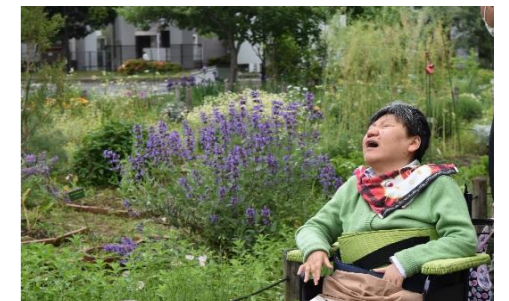
ラベンダーの香りに癒されて。