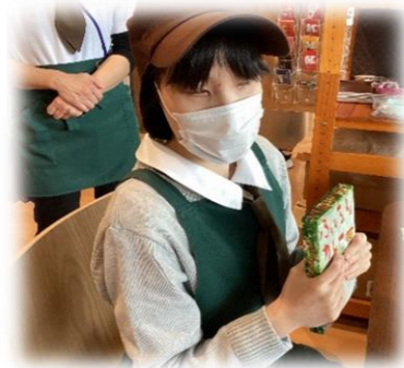
レトルトカレーもあります！