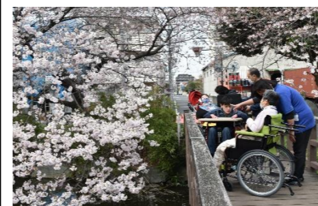
咲き誇る圧巻の桜。

春、新緑の季節、そして初夏と、それぞれの季節ならではの植物たち。色の美しさや、香りの華やかさなど、その時期でしか感じるこのできない季節感を存分に感じていただいています。